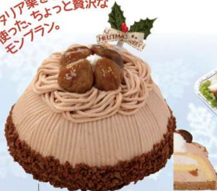
▲TB-07 イタリア菓のモンブラン (直径12cm) 税込 2,700円