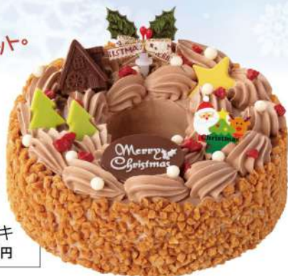
▶TB-04 クリスマスリースのチョコケーキ (直径15cm) 税込 2,700円