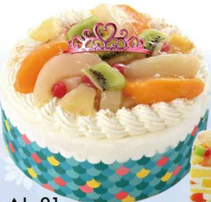
▲L-01 人魚姫のフルーツサンドケーキ (直径15cm) 税込 3,672円

黄桃に白桃、パイナップル、グロゼイユ(赤ずくり)、キウイ。キラキラのフルーツにティアラ! 中にカスタードホイップとフルーツをサンド。